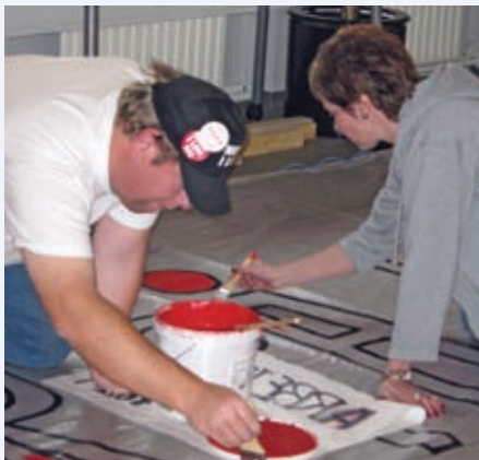
Der laves bannere

Ohh ... kunne vi bare slå ud med hænderne og sige, at det er blevet meget bedre med det psykiske arbejdsmiljø på FOA 1's arbejdspladser det seneste år. Men sådan er det desværre ikke. Telefonerne gløder stadig med henvendelser fra både enkeltpersoner og hele personalegrupper, hvis dagligdag er forpestet af et dårligt arbejdsklima.