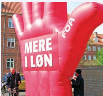
Et tydeligt budskab ved indkørslen til fagforeningen