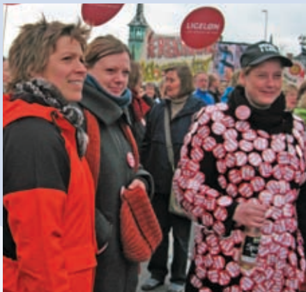
En kreativ markering fra FOA 1'erne

Så det fortsætter vi troligt med at fortælle arbejdsgiverne!