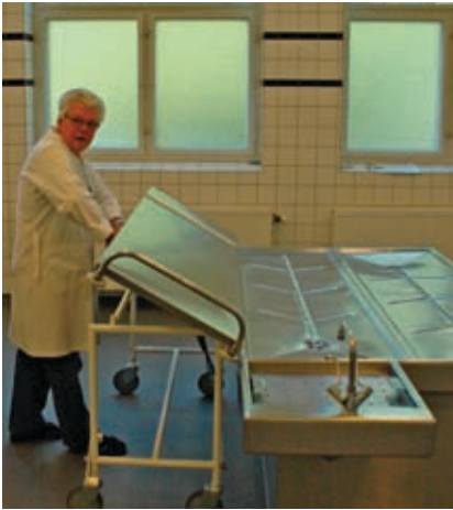
Lejerne kan vippes, så arbejdet bliver mindre tungt