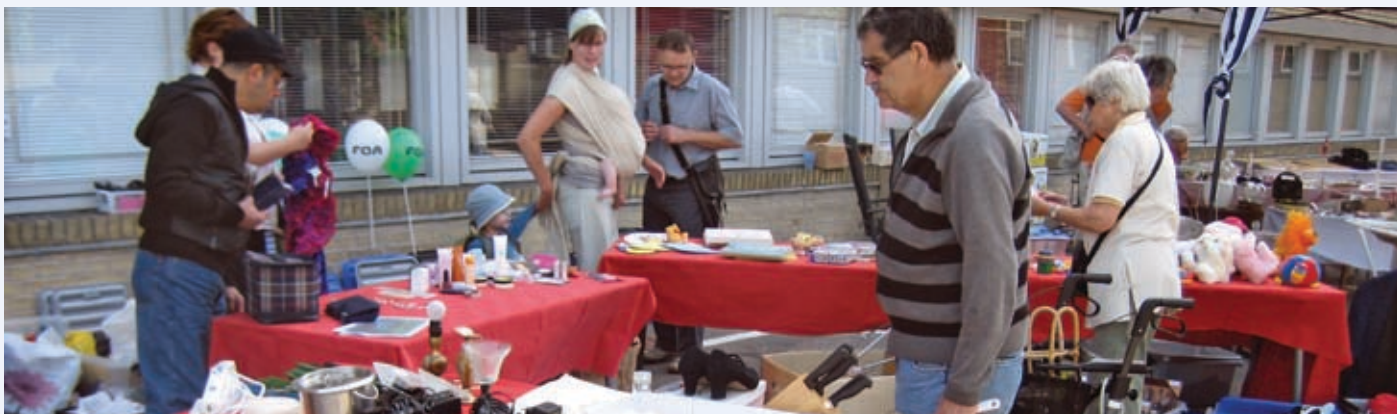
Loppemarked i gården