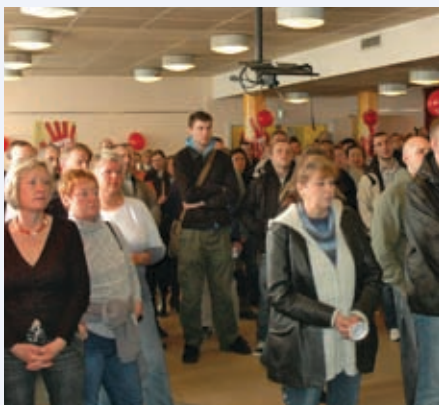
Udvalgte FOA 1-grupper går i konflikt den 16. april