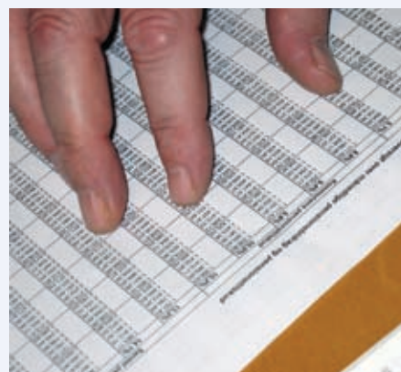
Vi er ikke altid helt enige med arbejds-giverne om tallene!