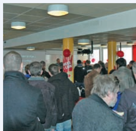
Orientering om konflikten