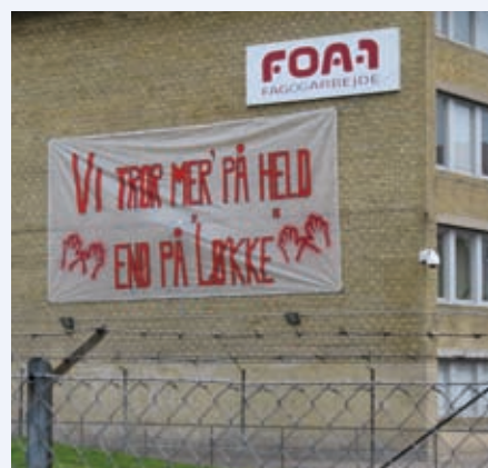
Afdelingshuset blev pyntet