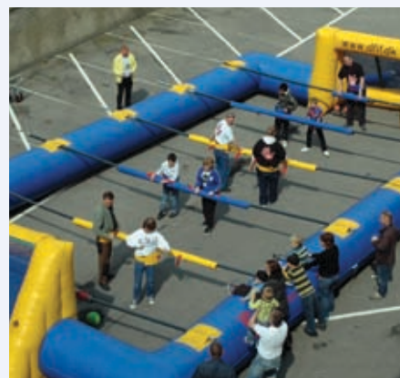
Gården bruges til andet end parkering. Her fussball

På Amager Hospital findes i forvejen en klub omfattende en afgrænset del af portørerne på hospitalet. Tilskud til denne klub er bortfaldet ved denne klubs oprettelse.