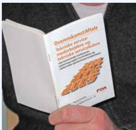
Fortolkning af overenskomster