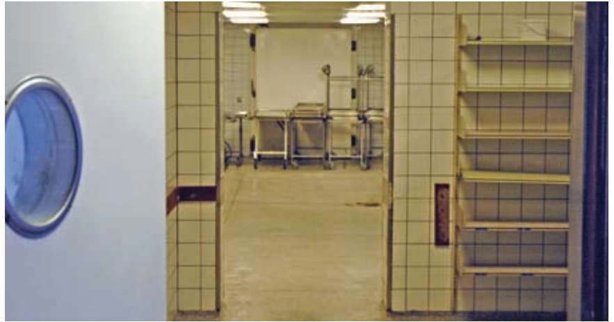
Kølerummet forrest og det helt kolde rum bag den hvide dør

sikre, at stålhandsken ikke afsætter mærker eller river noget i stykker under arbejdets udførelse.