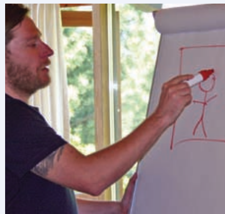
Repræsentantskabet var på kursus

Vi tror i øjeblikket på, at vi er meget tæt på afslutningen af denne sag, og at vi har en aftale eller forståelse med portørerne inden udgangen af november.