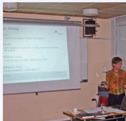
Undervisning i kælderen