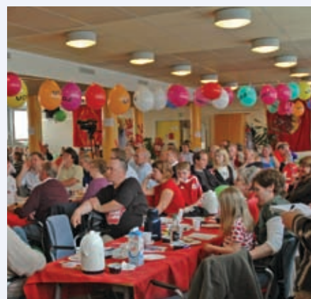
1. maj i afdelingshuset

Så hermed en opfordring til alle tillidsrepræsentanter, der ikke har taget FOA 1's grunduddannelse: Tag den.