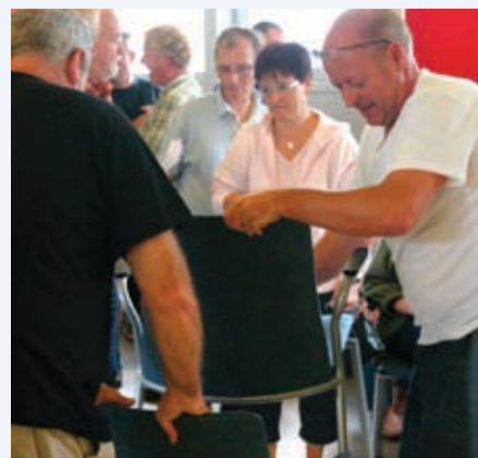
Rift om siddepladserne og stormøde igen!

Kontingentet til FOA 1 fastholdes dermed på kr. 206,- pr. måned for et fuldtidskontingent.