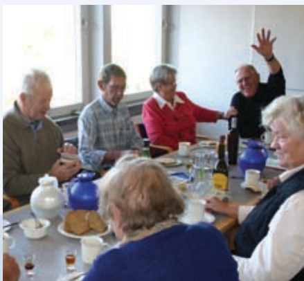
Huset bruges også af FOA 1s efterlønsklubber

Også i år har FOA 1 derfor holdt en række kurser om psykisk arbejdsmiljø, og på vores grunduddannelse