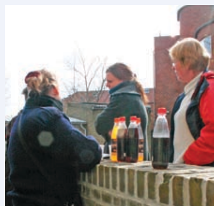
Lidt kollegial passiar i pausen