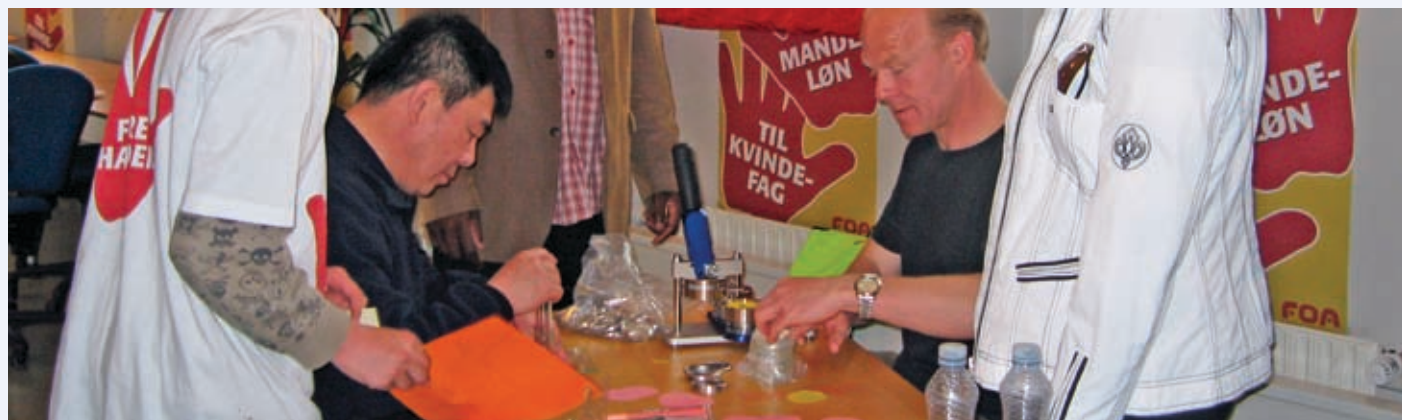
Der fabrikeres badges