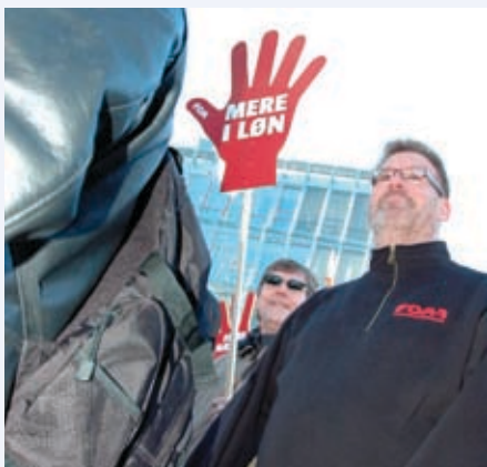
Fra en af forårets mange demonstrationer