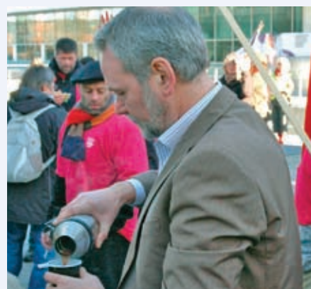
Forbundsformanden får lige en hurtig kop kaffe inden forhandlingerne i KL