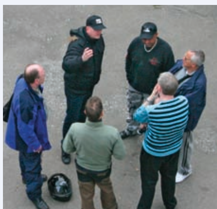
Der er dømt pausesnak i gården