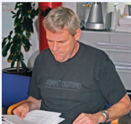
Formanden og hans papirer