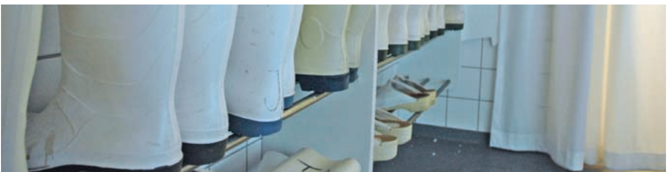
Hygiejnen er en selvfølge, så fodbeklædningen skal kunne tåle en spand vand

Og dét er vi levende, der jo også skal dø engang, glade for!