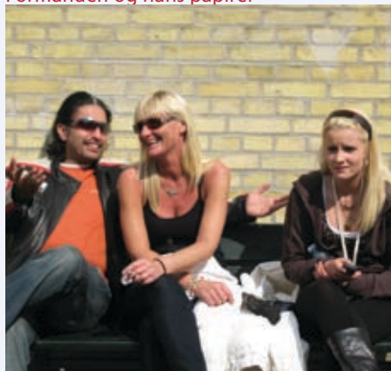
Kammeratskab og sammenhold