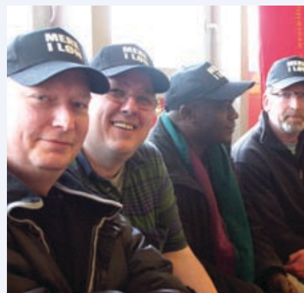
Klar til at gå i aktion!