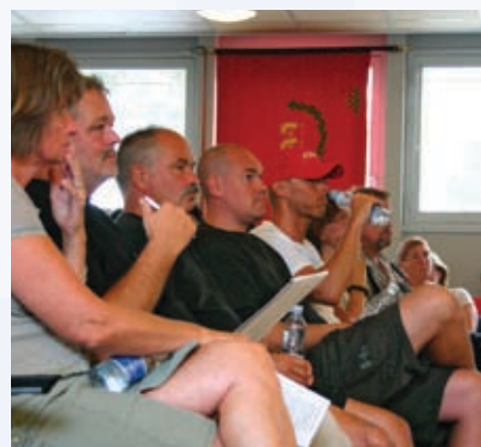
Stormøde i kælderen. Denne gang om udlicitering

FOA 1 skal også gennem aftaler for og med de tillidsvalgte arbejde for at forbedre forholdene for den enkelte, og FOA 1 skal arbejde for at øge organisationsprocenten.